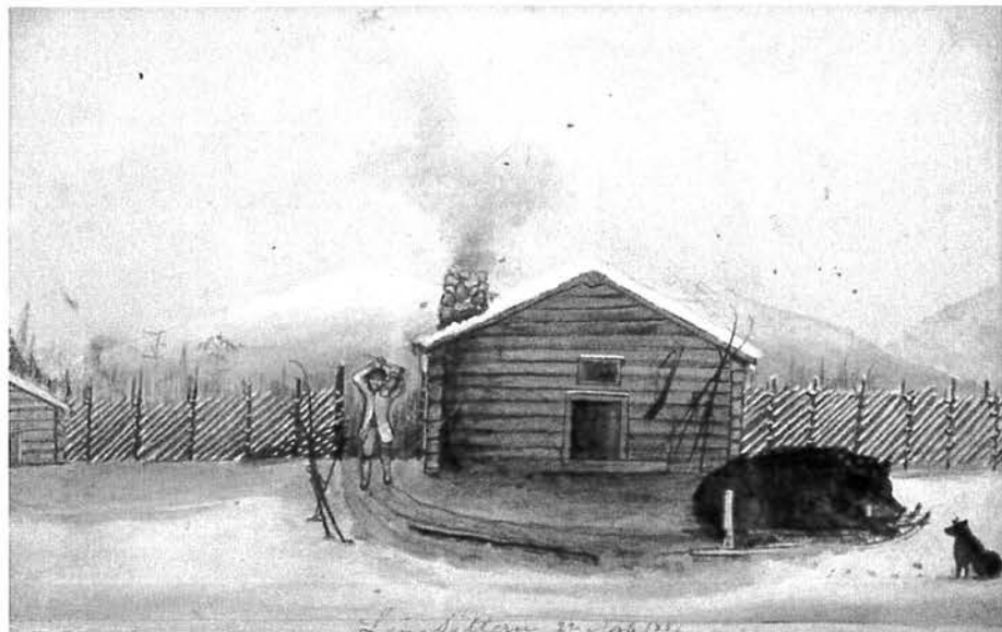
Tavla av Gustaf Schröder till minne av jakten vid Långsätern.

döma av storleken men förklaringen fick man när skinnet avfladdes och man kunde konstatera att björnen som var en hane var mycket magrare än vad som ansågs normalt. Jakten gick av stapeln i gränstrakterna mellan Värmland och Dalarna eller närmare bestämt mellan Dalby och Lima socknar med Långsätern som bas. (se bif skiss)